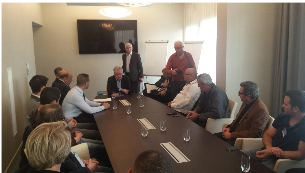
Le Consul général de France à Oran accueille la Caravane Catalane