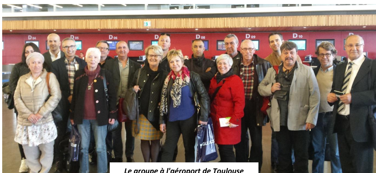
Le groupe à l'aéroport de Toulouse

Arrivée à 14h50 à l'aéroport Ahmed ben Bella d'Oran sous un soleil radieux et 25°C, la délégation a été accueillie par les partenaires Algériens de France Méditerranée Pays Catalan.