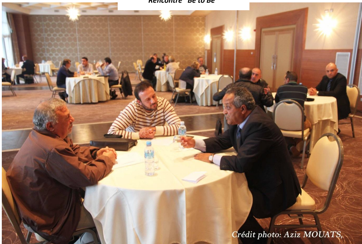
Rencontre "Be to Be"